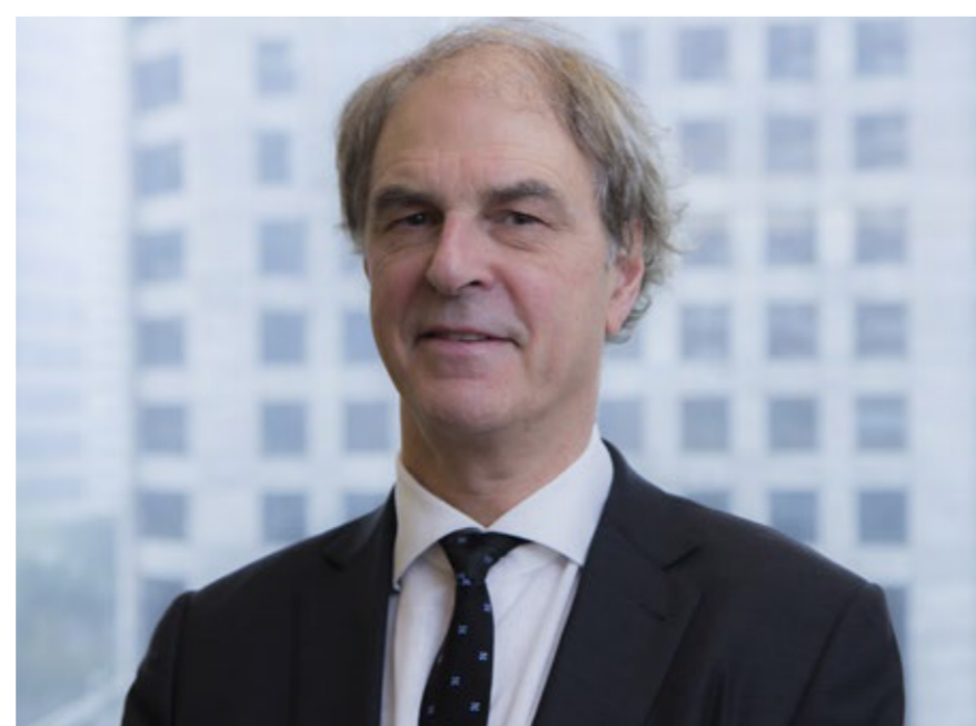
O dermatologista canadense Wayne Carey

Além de ser uma intervenção segura, a aplicação com ácido hialurônico é reversível. Em caso de algo ruim acontecer (uma reação inflamatória ou resultado diferente do esperado), basta aplicar a enzima hialuronidase e rapidamente tudo está resolvido.